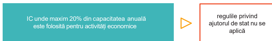
Figura 6: Activitate economică vs. activitate non-economică