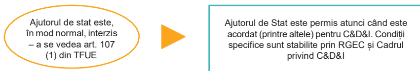
Figura 2: Ajutorul de stat permis

În conformitate cu jurisprudența și practica decizională consacrată a Comisiei, potrivit art. 107 (1) al TFUE, ajutorul de stat: